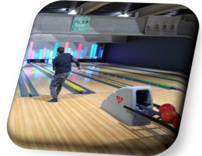
Figure 3 Devy